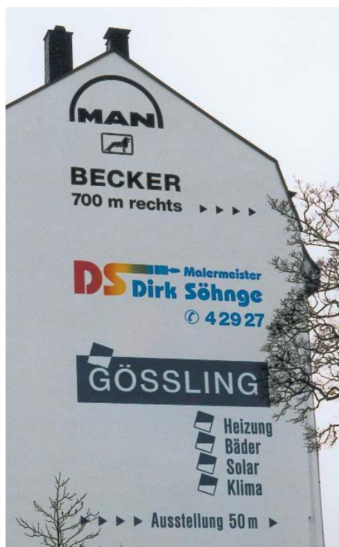
Hausfassade - werblich genützt 16m hohe Beschriftung mit RAUroll-Schablonenfolie.