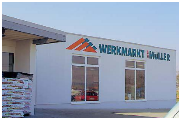
Beschriftung mit RAUroll - Schablonenfolie individuelles Firmenlogo kombiniert mit einer Standardschrift